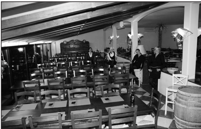
L'ampio locale dove si mangia con le sole mani. Provare per credere!

Si può gustare la genuina specialità dei GALLETTI ALLA BRACE, accompagnati da patate, affettati e pizza, fiumi di birra e tanta buona musica, a rallegrare cuore e palato.